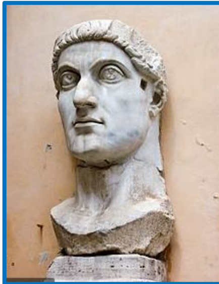
PAULUS PRUDENTISSIMUS “LO JUSTO NO DERIVA DE LAS LEYES”. “SON ELLAS LAS QUE NACEN DE LO QUE CONSIDERAMOS JUSTO”

Modernas generaciones de abogados no piensan que la Legislación positiva puede ser fatal para el Orden Económico. Por eso, buscan fuera de la ciencia jurídica los criterios para enjuiciar las fatales consecuencias de este desvarío en el pensamiento jurídico. En realidad el problema reside en las intimidades del propio Derecho cuando se considera autónomo.